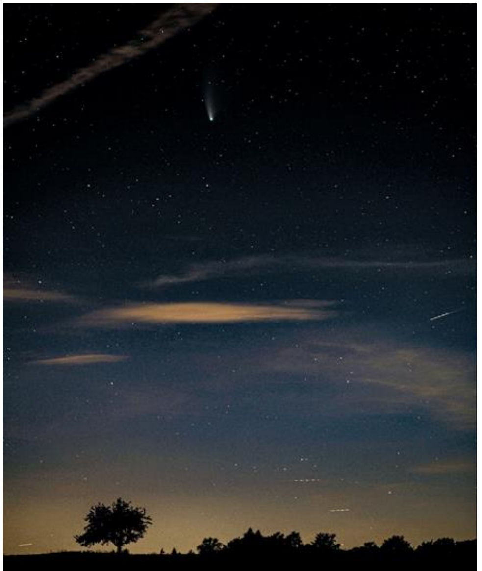
Komet Neowise am 22.07.20 über F.-C.

Um das zu erreichen werden wir uns dafür einsetzen, dass Beleuchtung in Bebauungs-