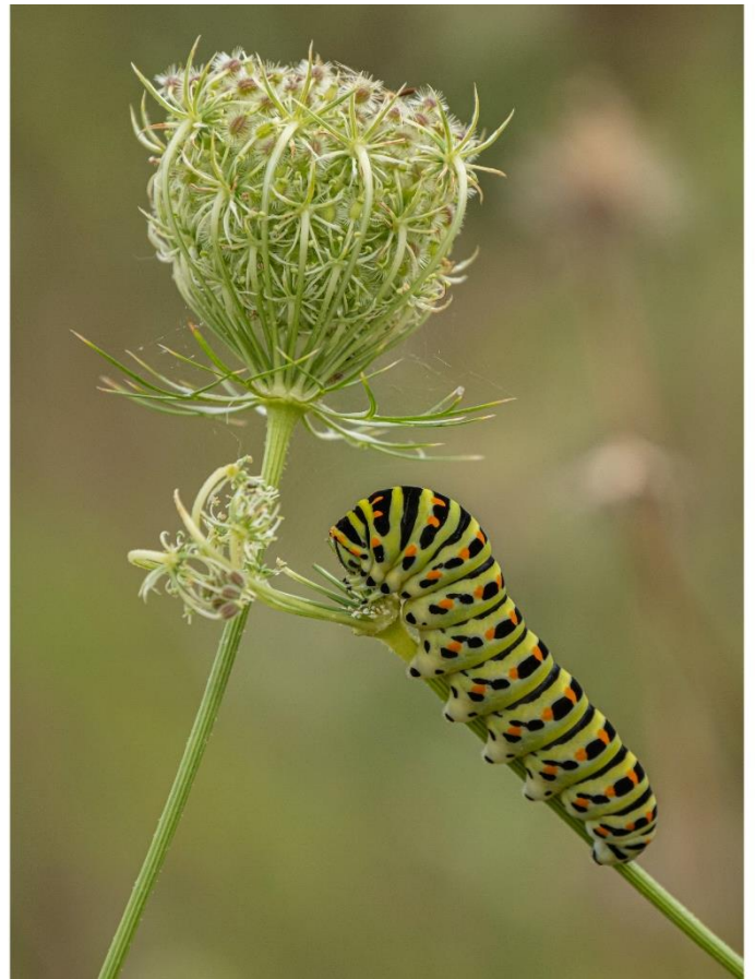
Schwabenschwanzraupe an wilder Möhre

Natürlich unterscheiden sich die Futterpflanzen und der Fortpflanzungszyklus